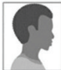
Figura 2. Modelo de Foto de Perfil

III- um vídeo individual recente (com, no máximo, 30MB e de até 30 segundos de tempo de duração), contendo resumidamente sua autodeclaração, a qual o candidato deverá iniciar dizendo: